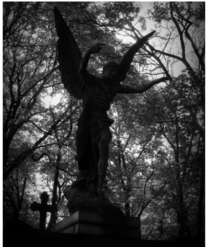
Cmentarz na Powązkach w Warszawie

Żałoba według tradycji trwała przeważnie rok. Dziś coraz więcej osób traktuje te wymogi bardzo indywidualnie. Coraz mniej osób, nawet tych z najbliższej rodziny, nosi czarny lub ciemny strój przez jakiś czas po pogrzebie. W rocznice śmierci zamawia się mszę za zmarłego.